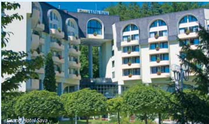
Grand Hotel Sava