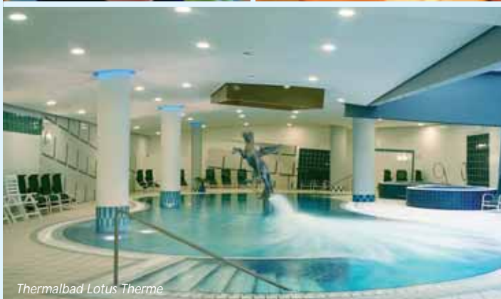
Thermalbad Lotus Therme