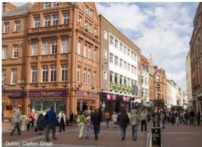
Dublin, Grafton Street