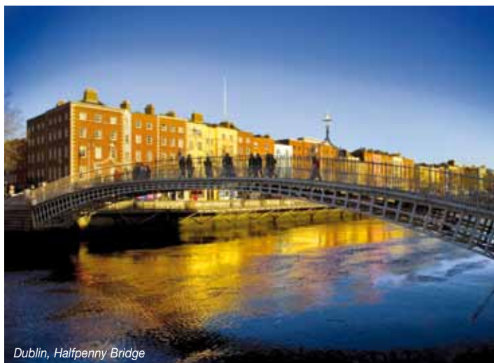
Dublin, Halfpenny Bridge