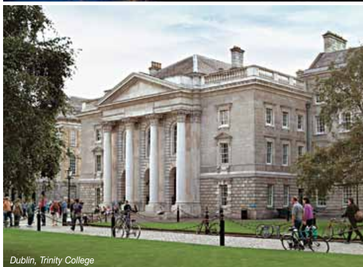
Dublin, Trinity College