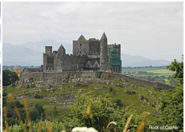
Rock of Cashel